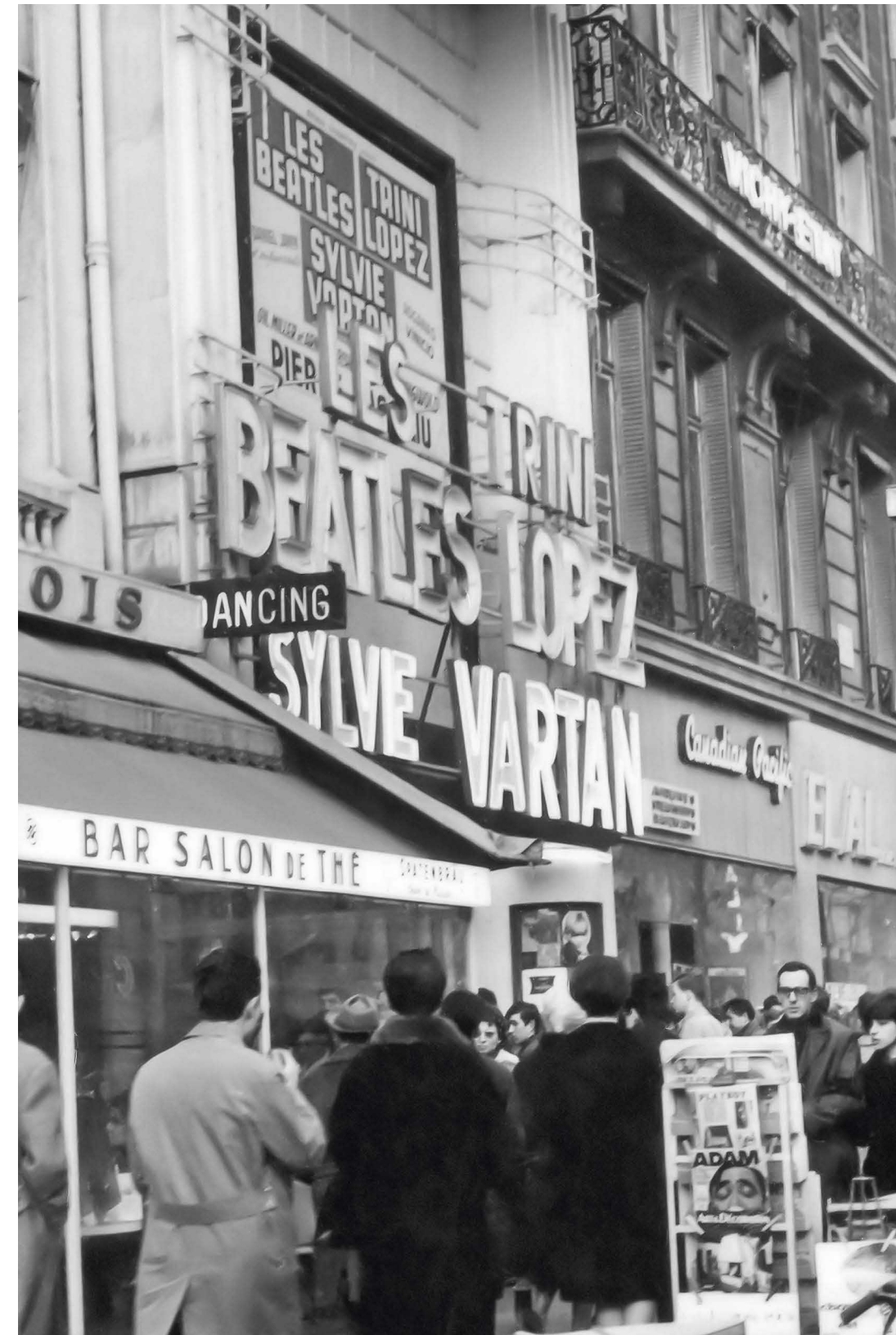
Quel frisson de voir notre nom en grandes lettres lumineuses sur la façade de l'Olympia.